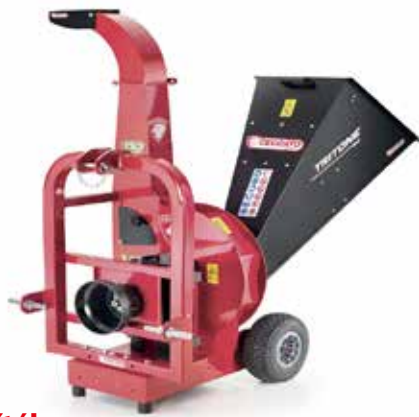
Tritone Big PTO