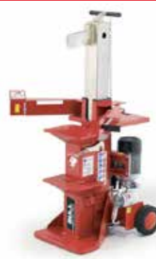
BULL 12 F