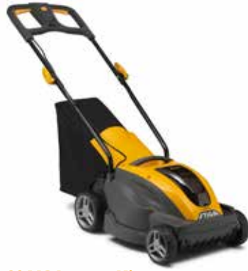
COMBI 336e Kit