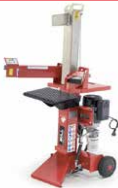
Hasogatógépek BULL 8L