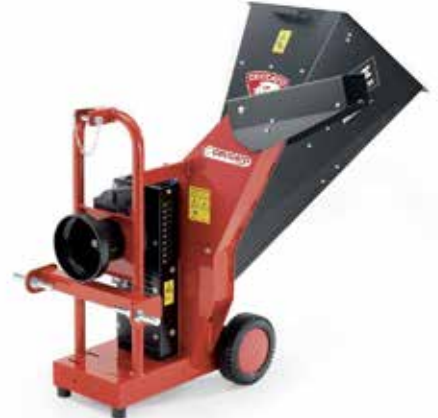
Tritone Maxi PTO