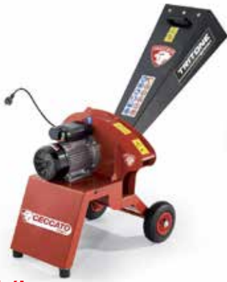
Tritone Sprint 230V