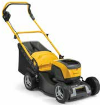
COLLECTOR 543 AE K