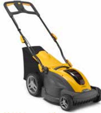
COMBI 340e Kit