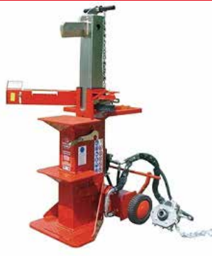
BULL 12 F PTO