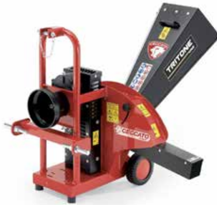
Tritone One PTO