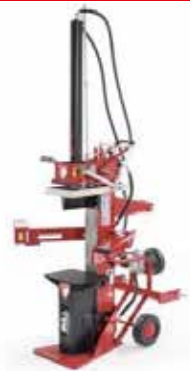
BULL 13 PTO