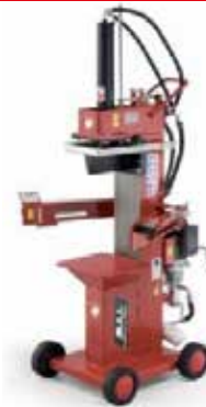
BULL 13 R4