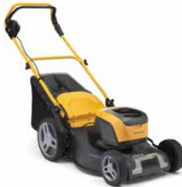
COLLECTOR 548 AE K