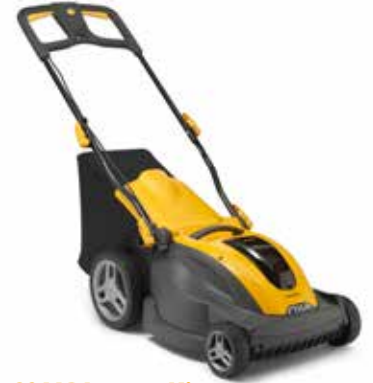
COMBI 344e Kit