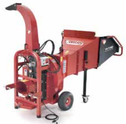
Tritone Super Monster PTO