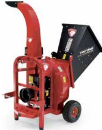
Tritone Monster PTO